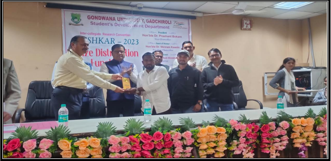
(Prize Distribution to students by Guest)